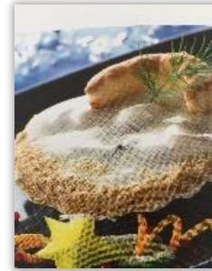
Coquille st Jacques