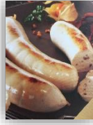
Boudin blanc morille