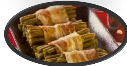
Fagot Haricot vert