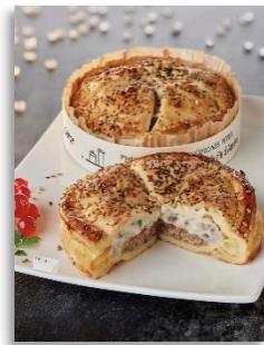
Tourte canard forestier