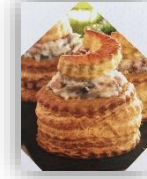
Bouchée ris de veau