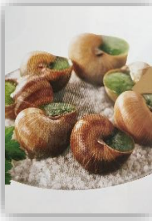
Escargot de bourgogne belle grosseur