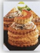
Bouchée ris de veau