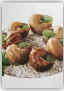
Escargot de bourgogne belle grosseur