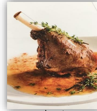
Jarret d'agneau au thym