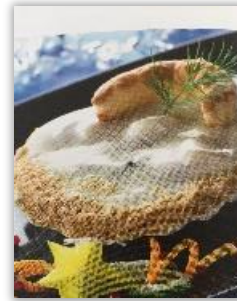
Coquille st Jacques