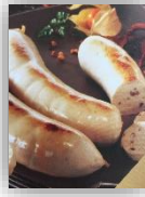
Boudin blanc morille