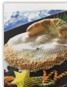
Coquille st Jacques