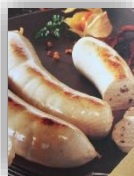
Boudin blanc morille