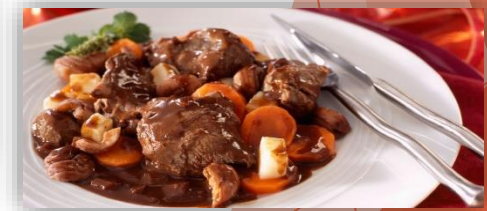
Civet de biche grand veneur