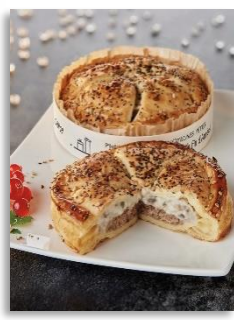
Tourte canard forestier