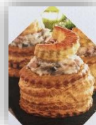
Bouchée ris de veau