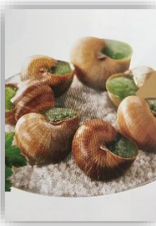
Escargot de bourgogne belle grosseur