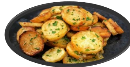
Timbale Pdt sarladaise