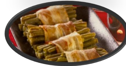
Fagot Haricot vert